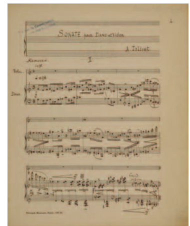
Lot 180 André JOLIVET. Manuscrit musical autographe signé Sonate pour piano et violon (4 000 / 5 000 €).