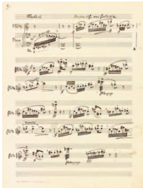
Lot 253 Olivier MESSIAEN. Manuscrit musical autographe signé Le Merle noir pour flûte et piano, 1952 (12 000 / 15 000 €).

Vente aux enchères publiques les 17-18 juin